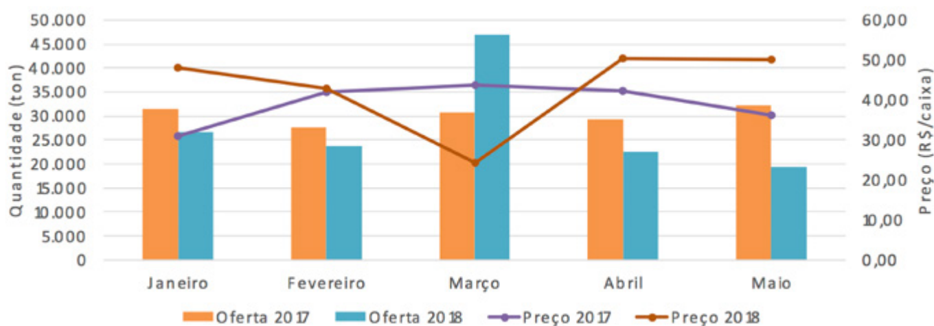
Gráfico 2. Quantidade ofertada e preços da cenoura no mercado atacadista de janeiro a maio de 2017 e 2018.

Nos meses seguintes, a oferta de cenoura no mercado atacadista se reduziu, chegando a 19.357,80 toneladas em maio/18. Esse valor foi cerca de 67% inferior ao do mesmo período no ano anterior e contribuiu para a alta nos preços. Segundo a Conab, o fechamento das estradas em função da greve dos caminhoneiros refletiu na oferta desse produto.