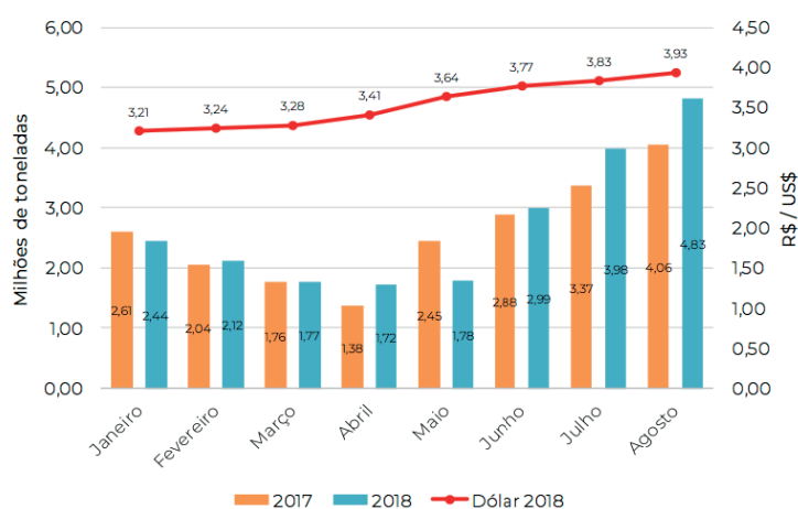
Gráfico 1. Quantidade de fertilizantes entregue ao mercado brasileiro de janeiro a agosto (2017 e 2018), e taxa de câmbio do dólar de janeiro a agosto de 2018.

3,98 e 4,83 milhões de toneladas de fertilizantes no mercado brasileiro. O volume distribuído nesses dois meses superou em 18,55% o total de julho e agosto de 2017.